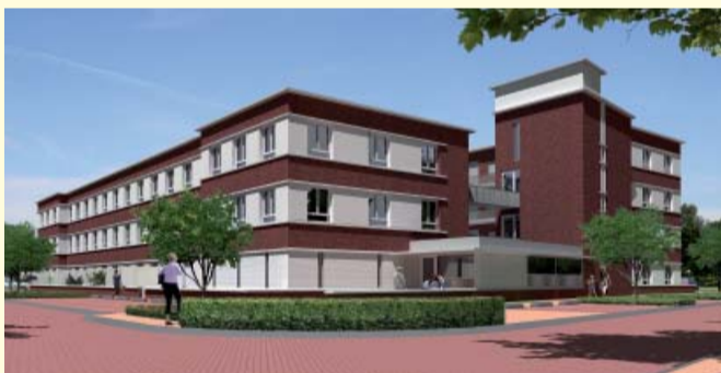
40 3-kamer huurappartementen

In 2008 start Centrada met de bouw van 96 woningen (zowel 55-plus als een-gezinwoningen) in het Hanzepark. Oud Schouw-oost bewoners die interesse hebben in één van deze woningen, kunnen dit kenbaar maken door zich te melden via de website www.centrada.nl of door te bellen met de klantenservice van Centrada, bereikbaar op telefoonnummer 0320 239 600.