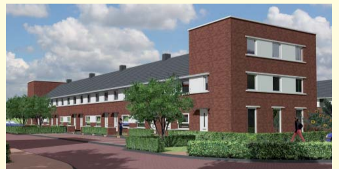
38 eengezins huurwoningen (tussenwoningen)