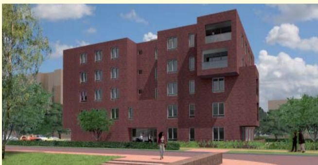
18 levensloopbestendige huurappartementen